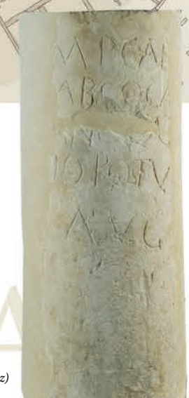
Milarría / Miliario (Errekaleor, Vitoria-Gasteiz)

Aztarnategiko indusketatik ateratako materialak Bibat Museoaren Arkeologia ataleko hirugarren solairuan daude ikusgai. Hori bizitatzea gomendatzen dugu, horrela aztarnategiko ibilalditik ateratako informazioak osatu ahal izateko.