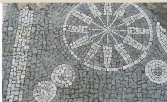
Errosetoidun mosaikoa Mosaico de los rosetones

Es, por tanto, el área más analizada desde el punto de vista historiográfico y la más conocida del yacimiento. Sin embargo, apenas acertamos a ver una pequeña parte de la compleja realidad de la sociedad de aquellos tiempos, cuyos detalles irán siendo desvelados por las nuevas investigaciones.