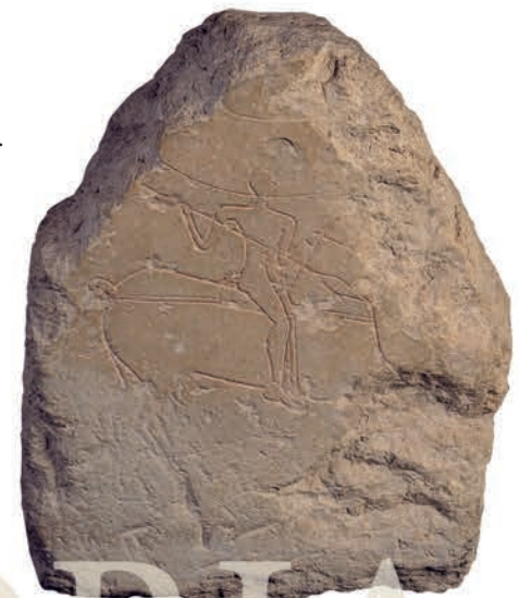
Zaldizkoaren estela Estela del Jinete