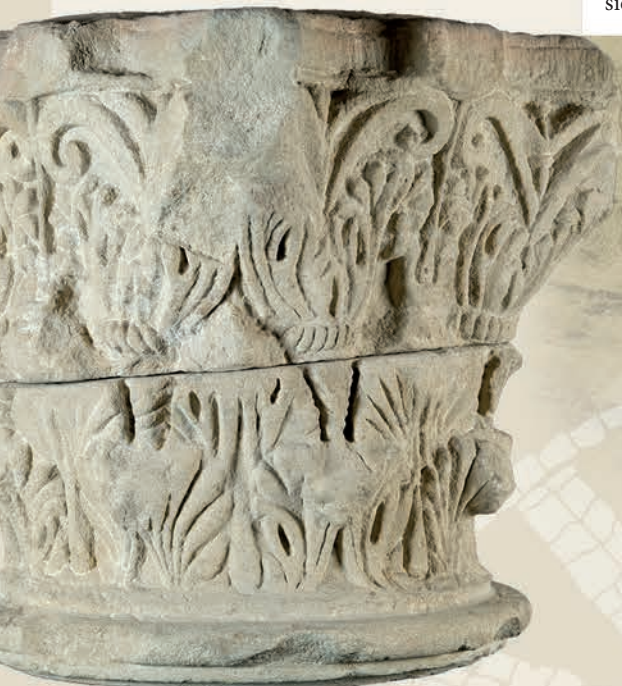
Tenplu ingurunean aurkitutako korintoar estiloko kapitela Capitel de estilo corintio localizado en la zona del templo