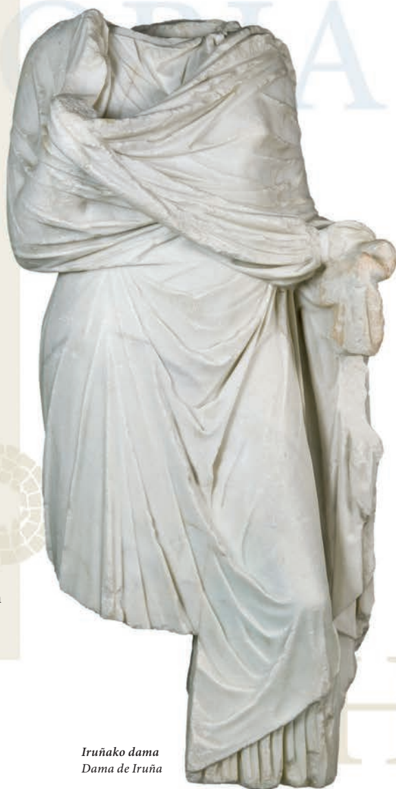
Iruñako dama Dama de Iruña

III. mendean zehar, haren hiri hedadura murriztu egin zen. Hala ere, aldi hau gutxien ezagutzen dena da. Mende horren amaiera aldean edo hurrengoaren hasiera aldean, harresiak eraiki ziren. Hirian egin zen azken herri lan handia izango ziren.