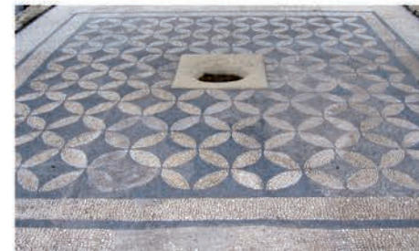
Pompeia Valentinarren etxeko mosaikoa Mosaico de la casa de Pompeia Valentina

Durante el siglo III, redujo su superficie urbana aunque sin duda este periodo es el peor conocido. A finales de dicho siglo o principios del siguiente se construyeron las murallas que serían la última gran obra pública realizada en la ciudad.